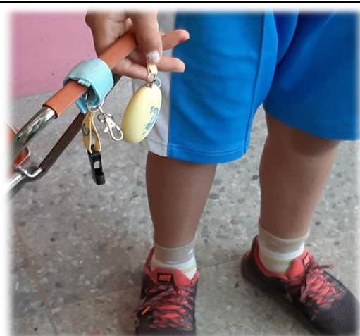
圖4 纏在書包提把上