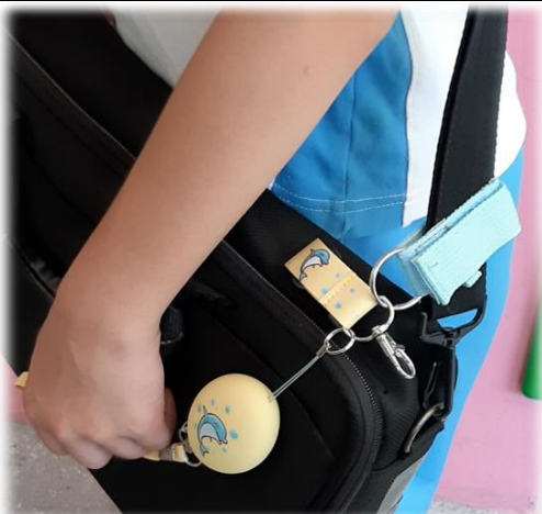
圖5 單肩或斜背書包，綁在帶子或扣環