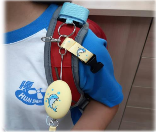
圖2 綁在書包肩帶扣環上