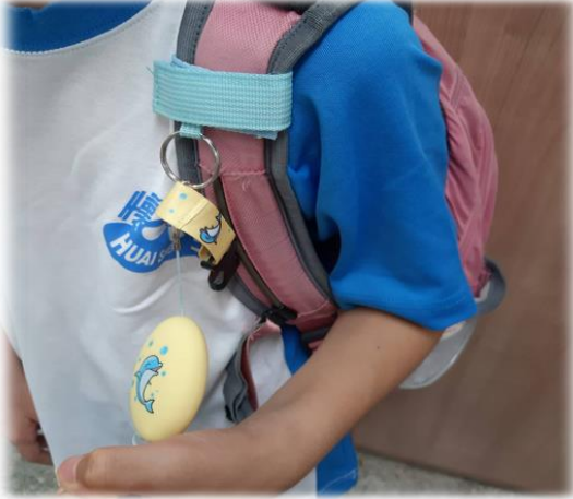
圖1 綁在書包肩帶上