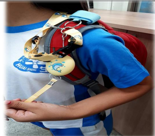
圖3 繞過提把纏在肩帶上