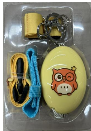
學生防身警報器本體(黃色) 附繩帶與魔鬼氈