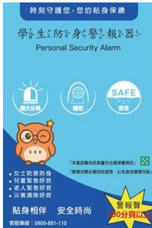
學生防身警報器包裝外觀(正面)