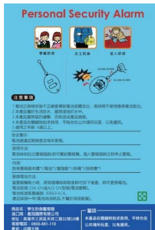
學生防身警報器包裝外觀(背面)